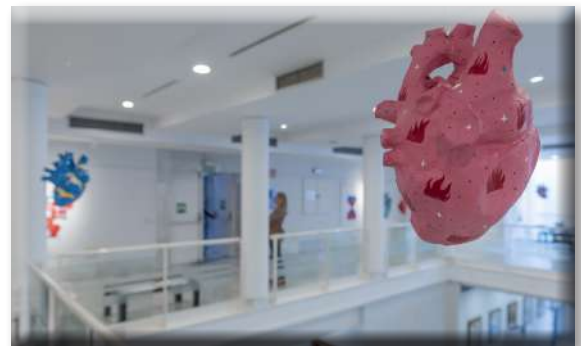
Campaña "PACTOS por tu corazón"

Estas enfermedades se pueden prevenir hasta en el 80% de los casos siguiendo hábitos de vida saludables. Así, la campaña pone el foco en el cuidado de los principales factores de riesgo: P (presión arterial), A (alimentación), C (colesterol