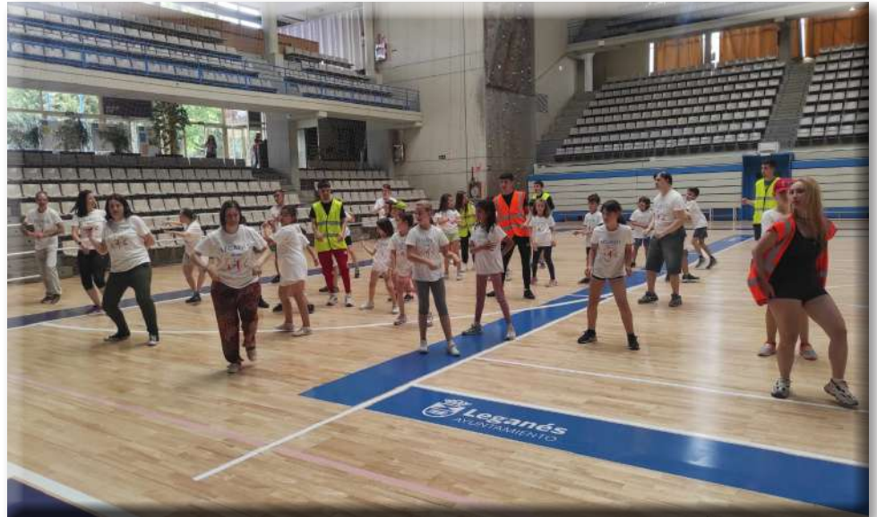
Imagen de la jornada "Leganés se Mueve por la Inclusión"

Esta actividad, enmarcada en los proyectos que España se Mueve desarrolla en el marco Erasmus+ de la Comisión Europea, tiene el objetivo de concienciar a la ciudadanía sobre las enormes posibilidades de inclu-