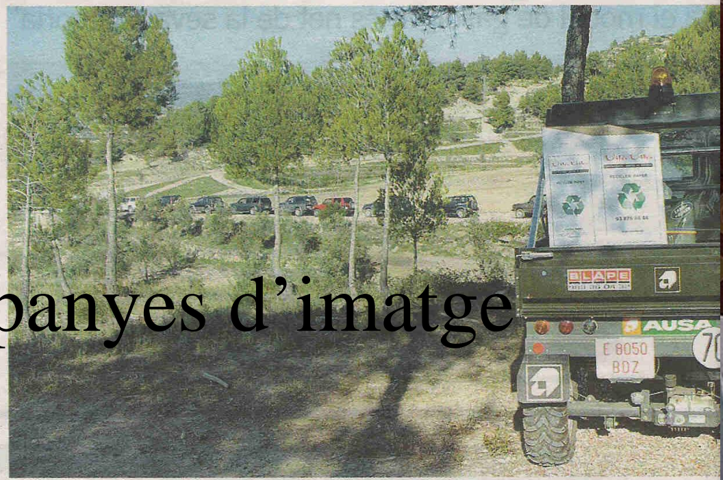
EN CARAVANA. El grup de tot terrenys s'endinsen a les muntanyes del Bages per netejar d'escombraries els boscos.

La ruta es va portar a terme per la zona del Bages, on la caravana va visitar el Parc Mediambiental i després es va endinsar pel bosc (sempre circulant per pistes i camins legals) per recuperar, entre altres objectes inútils, un vehicle