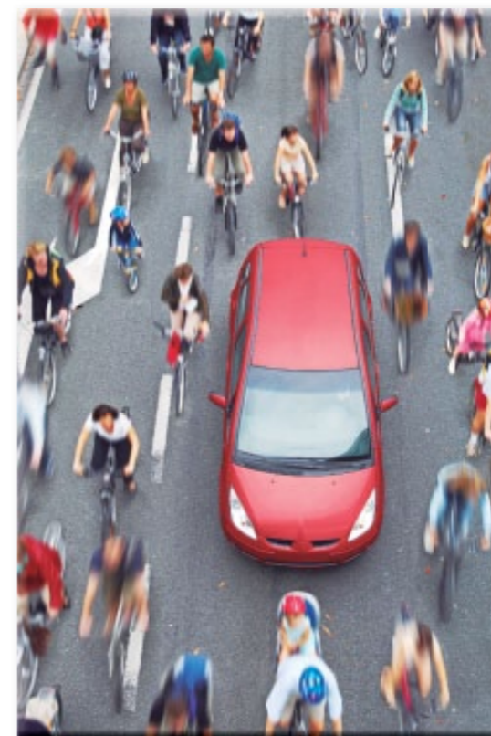
Actividades deportivas de la Unión Europea

de género y las sinergias entre deporte y salud.