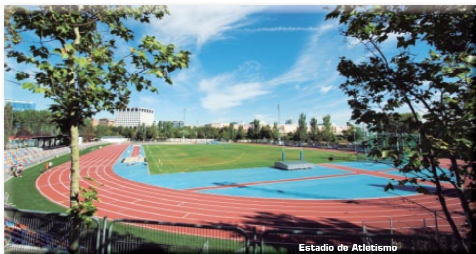
Estadio de Atletismo

Los vecinos de Alcobendas valoran con 7,8 puntos la satisfacción que tienen por vivir en