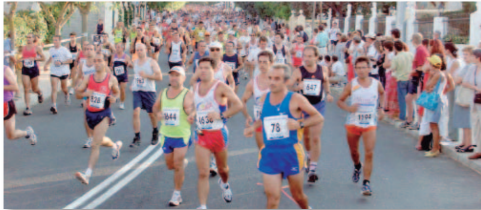
Carrera popular de la Diputación de Valencia

La mayoría de las administraciones provinciales han reducido sus presupuestos en los últimos cinco años, aunque existen algunos casos en los que las partidas han aumentado. Un ejemplo es, un año más, Gran Canaria, que ha incrementado un 151% su inversión. Lugo (24,5%) y Segovia (9,5%) son otras de las entidades que han apostado en sus presupuestos por la práctica deportiva. Con respecto a 2011, destacan Formentera, que ha