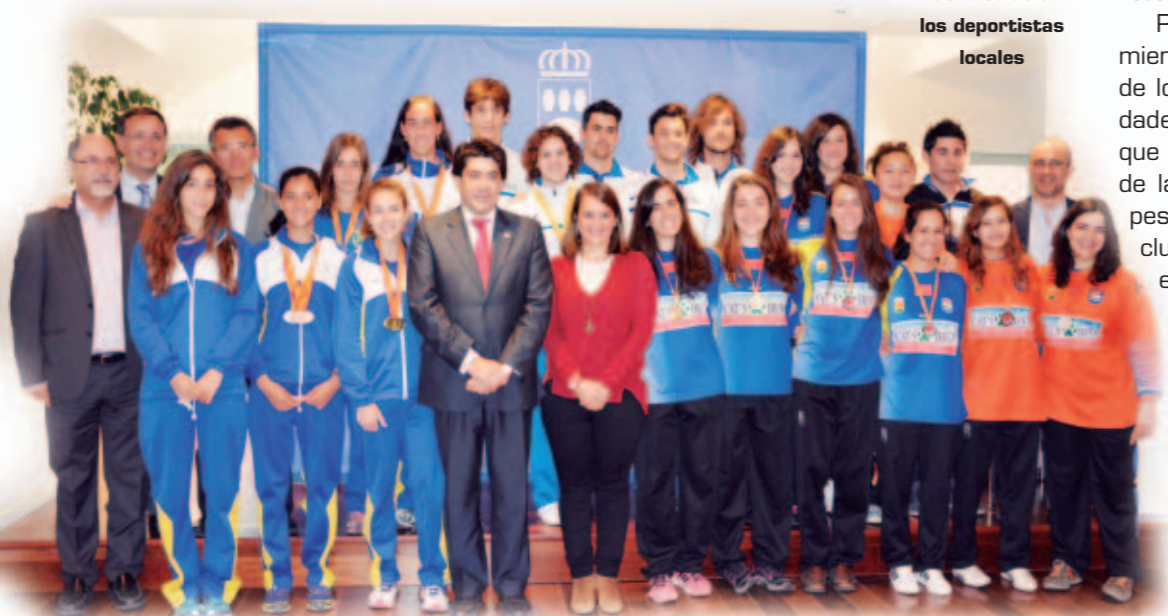
Recepción del alcalde a los deportistas locales